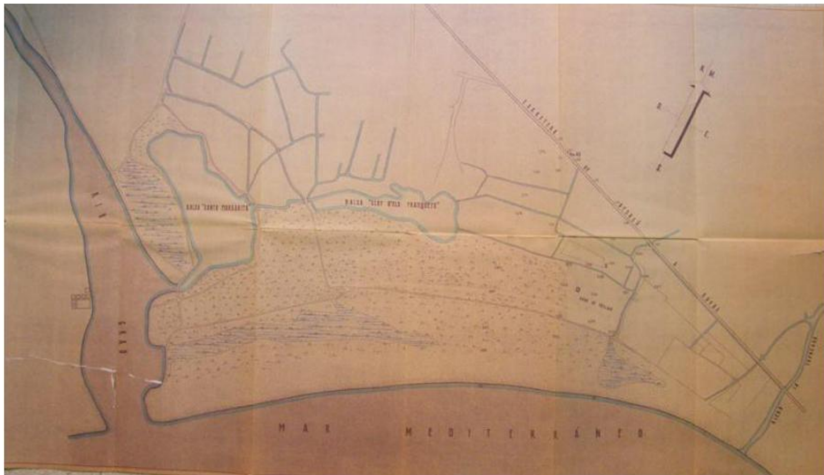
Estado inicial de la zona con sus acequias según el Plan Parcial