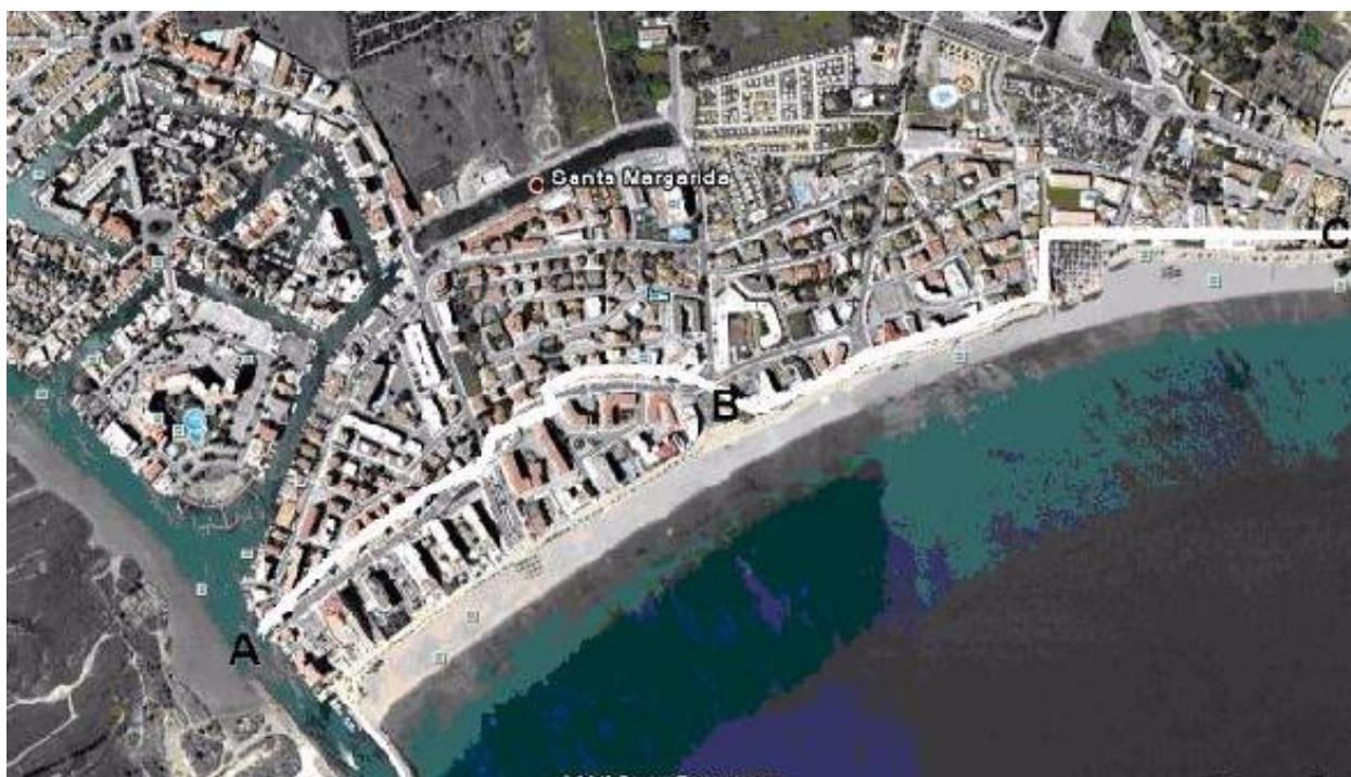
A ⇔ B = Deslinde de 1964

Los deslindes de 1962 y 1964 declararon dominio público marítimo terrestre una amplísima franja de terreno costero que los funcionarios de Costas, incumpliendo con su deber, no protegieron debidamente y no inscribieron en el registro de la propiedad, ya que estos apetitosos terrenos en primera línea de mar y en pleno "boom" turístico, estaban fuertemente solicitados por toda clase de especuladores. Como consecuencia, los especuladores, con la permisión de algunos funcionarios de Costas, edificaron todo el dominio público marítimo terrestre deslindado en 1962 y 1964, llenándolo de grandes edificios de hoteles y apartamentos que luego vendieron, libres de cargas, a ciudadanos españoles y europeos que, de buena fe, creyeron los datos que aparecían en el registro de la propiedad, para encontrarse hoy ,estos ciudadanos inocentes, timados y con un gran perjuicio económico del que el Estado Español es responsable subsidiario.