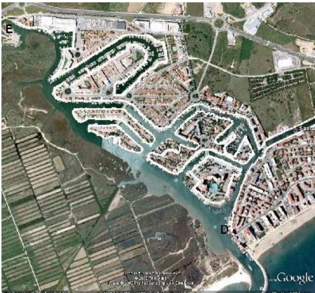
D↔E Deslinde 2010, El deslinde se inició a más de 200 metros del mar

En la actualidad, como ya no queda dominio público marítimo terrestre donde poder edificar para seguir consiguiendo los enormes beneficios obtenidos en el pasado, los funcionarios han modificado el deslinde oficial vigente para incorporar ilegalmente al dominio público marítimo terrestre toda una serie de parcelas de propiedad privada con las que seguirán alimentando a los especuladores (como demuestran claramente los planes de la Generalitat y el Ayuntamiento de Rosas). ¿Vaya Usted a saber a cambio de que?. Lo que sí que está claro es que no es para proteger la costa ni el medioambiente, ni cumplir con los fines y objetivos de la ley de Costas, sino para todo lo contrario.